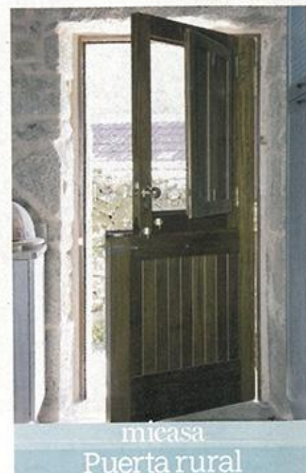
micasa Puerta rural

con muros de piedra, vigas vistas y puertas y ventanas que respetasen las características arquitectónicas de la zona. La casa tiene dos plantas y un agradable porche para disfrutar de la naturaleza. En la planta baja se encuentran el salón, la cocina, las habitaciones infantiles y un baño, y en el semisótano, el dormitorio principal con su baño. La empresa Excavaciones y Construcciones Laureano Covelo se encargó de las obras, y la decoración corrió a cargo de los dueños. ■