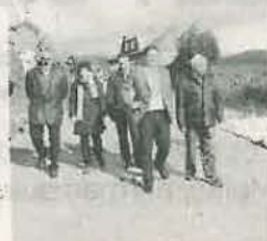
Recorrido por las obras del rural

la colocación de un muro de contención para salvar desniveles, así como la recuperación y mantenimiento del banco y las piedras que formaban parte del Camiño Real en su bajada al Puente de los Remedios. ■